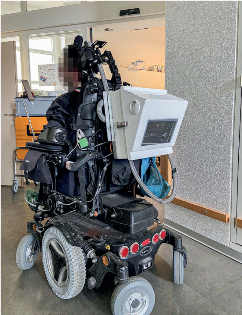
Figure 3: Le recours à un deuxième appareil de ventilation est un facteur important pour la qualité de vie de patients très dépendants de la ventilation, et permet, en utilisant un ventilateur avec une batterie performante et en l'adaptant sur un fauteuil électrique, d'augmenter l'autonomie et la sécurité des patients.

Dans certaines indications, le suivi collaboratif entre MPR et une équipe multidisciplinaire a montré un bénéfice tant sur la qualité de vie que sur la survie: c'est en particulier le cas pour la SLA [5].