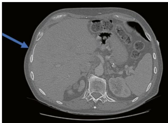
Abbildung 1: CT, Transversalschnitt, mit Katheter im Recessus costo-diaphragmaticus rechts (Pfeil).