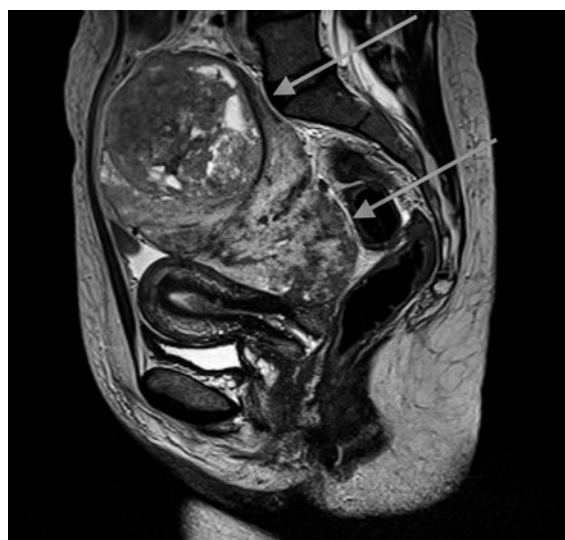
Abbildung 1: Magnetresonanztomographie der Patientin kurz nach der notfallmässigen Vorstellung (Region: Becken; T2 TSE-gewichtete Sequenz). Pfeile: abgekapselter Weichteiltumor. Mit bestem Dank an die Kollegen der Radiologie des GZF, Rheinfelden.

Erst unter einer Dauerinfusion mit Glukose 10% und einer Laufgeschwindigkeit von 110 ml/h (entsprechend 264 g Glukose/d oder 66 Stück Würfelzucker) konnten Blutzuckerwerte im Normbereich erreicht werden. Eine versuchsweise Reduktion der exogenen Glukosezufuhr