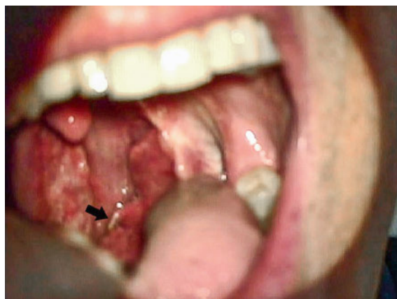
Abbildung 1: Fremdkörper im Unterpol der linken Tonsille.