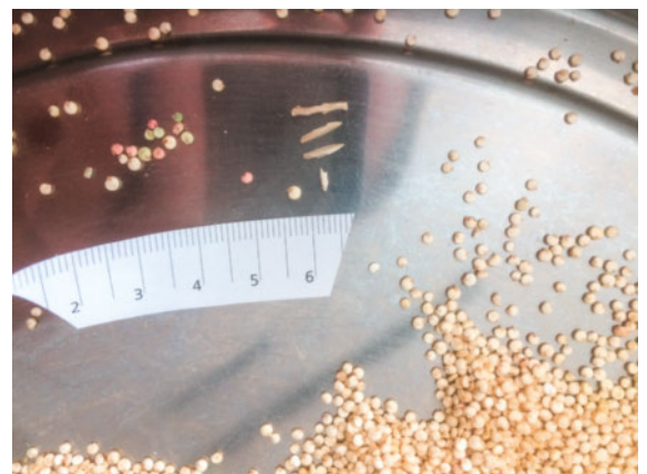
Abbildung 3: Verunreinigungen.