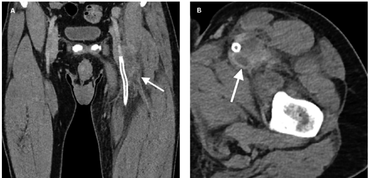
Abbildung 2: Computertomographie mit Kollektion um den proximalen Stent in der linken Leiste (Pfeil); koronar (A) und axial (B).

auf die A. profunda femoris. Aufgrund des Weichteildefektes nach grossflächigem Débridement musste nach Verschluss der Gefässloge in der Leiste ein Vakuum-Verband angelegt werden. Der definitive Wundverschluss konnte neun Tage später mit einer Lappenplastik des M. sartorius erfolgen.