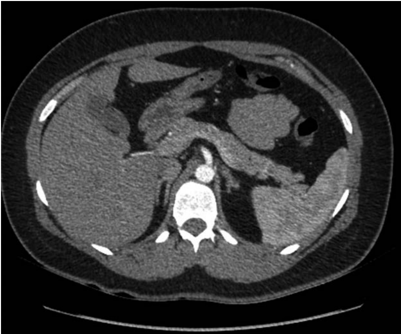
Abbildung 3: CT-Abdomen mit Kontrastmittel, vier Monate nach Nebennierenblutung links.

Zur Nephroprotektion wurde Telmisartan in Kombination mit Hydrochlorothiazid gegeben und bei Verdacht auf einen primären Hyperaldosteronismus zusätzlich Spironolacton verabreicht. Labetalol konnte wegen der intermittierend noch bestehenden hypertensiven Werte (bis zu 160 mm Hg systolisch) erst ambulant abgesetzt werden.