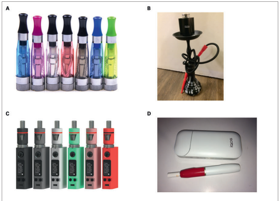
Figure 2: Diversité des cigarettes électroniques, e-chichas et «heat but not burn devices». A: cigarette électronique (également appelée e-chicha); B: narguilé électronique (également appelé e-narguilé ou e-chicha); C: cigarette électronique de 3 e génération (également appelée «MOD» ou «tank»); D: «heat but not burn device» constitué d'un support électronique avec résistance et du «heat stick» (qui contient le tabac et le filtre). Derrière, une unité de chargement mobile est présentée.

en Suisse sans limitation d'âge. La diversité des composants et arômes est énorme. En relation avec ces produits, il est souvent question de la «vapeur» produite, les utilisateurs se nomment «vapoteurs». Il serait toutefois plus correct de parler d'un aérosol qui est inhalé. Les e-cigarettes de première génération sont semblables aux cigarettes de tabac et fonctionnent avec une faible tension de batterie.