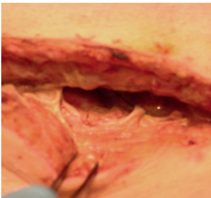
Abbildung 1: Darstellung der Faszien dehiscenz vor Beginn der Vakuumtherapie.

Abatacept (anti-CTLA-4LG) ist ein Biologikum mit immunmodulierender Wirkung, das bei JIA und anderen Autoimmunerkrankungen mit grossem Erfolg [3–5] eingesetzt werden kann. Unter Biologika ist das Risiko für Infektionen erhöht [4]. Bei chirurgischen