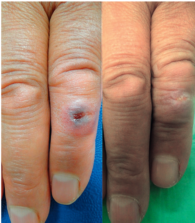
Abbildung 2: Verlauf der kutanen Läsion bei unserer Patientin zwei bzw. fünf Tage nach Therapiebeginn.

Laut einem Eintrag in ProMED (Program for Monitoring Emerging Diseases; Internet-basiertes Meldesystem für Ausbrüche durch Infektionen bzw. Toxine bei Menschen und Tieren) wurden von offizieller türkischer Seite schliesslich zehn Fälle eines kutanen Anthrax in dem türkischen Dorf, in dem die Patientin zu Besuch war, bestätigt [1]. Die erkrankten Familienangehörigen waren alle am Schlachten beteiligt gewesen. Nähere Angaben zum Infektionsweg bei anderen Betroffenen (z.B. Infektion beim Verarbeiten des Fleisches in der Küche) konnte die Patientin nicht machen.