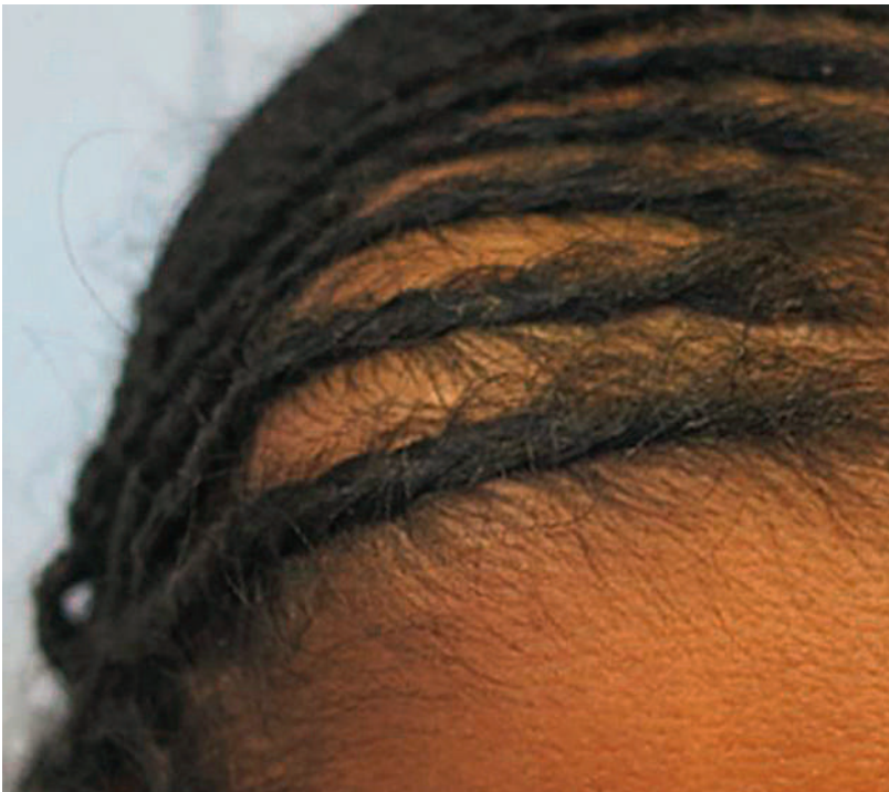
Abbildung 1: Raumforderung frontal rechts.

Bei dieser Patientin postulieren wir eine reaktivierte Tuberkulose unter anderem auch des Os frontale mit Ausbildung eines subperiostalen Abszesses. Tuberkulöse «Pott's Puffy»-Tumore sind im Gegensatz zu den «üblichen» bakteriell bedingten Fällen selten in der Literatur beschrieben – dies obschon die Reaktivierung der Mykobakterien in diversen Knochen gut bekannt ist. Bezeichnenderweise war es Sir Percivall Pott, der