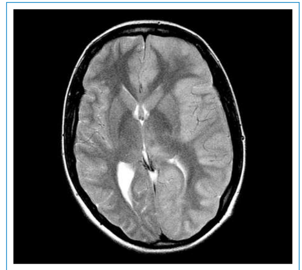
Abbildung 2 MRI T2 nach Zustandsverschlechterung: kortikale Schwellung der linken Hemisphäre mit Komprimierung des Seitenhorns und Mittellinienverlagerung, ausserdem Ödem im linken posteriorem Thalamus.

zeigt werden. Ein Verlaufs-Schädel-MRI ein Jahr nach akutem Hirnödem ergab nebst einem stationären Ausmass der Kleinhirnatrophie eine vollständige Rückbildung der vorgängig residuellen Signalstörungen kortikal linkshemisphärisch und links thalamisch.