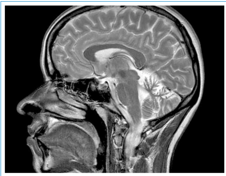
Abbildung 1 MRI des Schädels T2 sagittal: vorbestehende Kleinhirnatrophie.