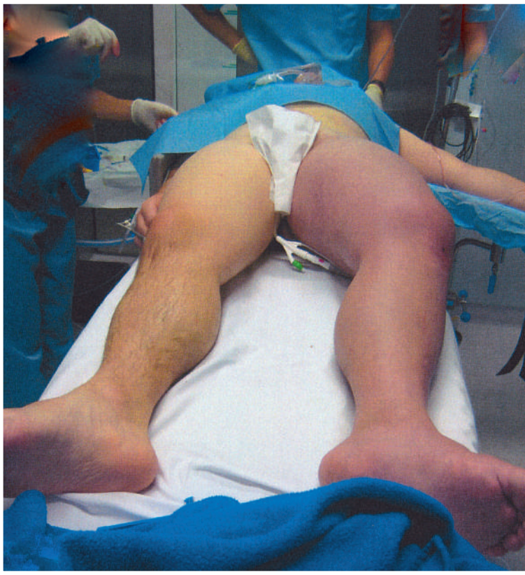
Abbildung 1 Phlegmasia coerulea dolens (mit bestem Dank an die Kollegen des Kantonsspitals Schwyz).

Insgesamt gilt das Risiko für eine Thromboembolie unter atypischen Neuroleptika als gering. Eine Fallkon-