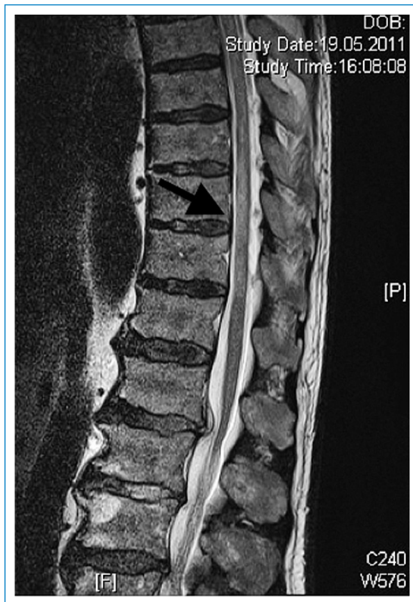
Abbildung 1 MRI (T2w-Sequenz) bei Spitaleintritt mit den hyperintensiven Läsionen des Myelons auf der Höhe Th8–11.

sche Kriterium, und die Myelitis ist zusätzlich durch eine Neuritis des Nervus opticus kompliziert [5]. Bei der VZV-Myelitis ist der frühe Therapiebeginn entscheidend, obwohl bisher keine Standardtherapie eta-