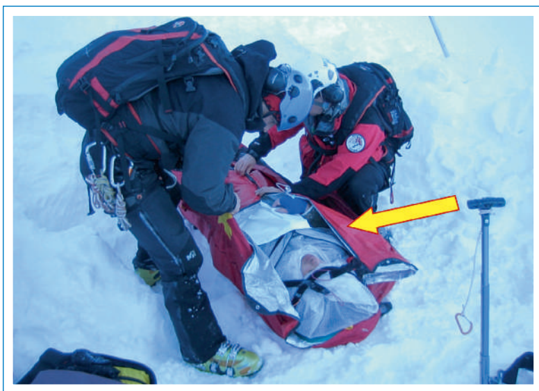
Figure 2 «Bubble Wrap» pour le réchauffement passif (Guides de montagne, MFXB/Air-Glaciers, Sion, avec leur aimable autorisation).

Pour ce qui est du transfert hospitalier du patient hypotherme, c'est normalement l'hôpital le plus proche qui est averti. Tous les patients en hypothermie sévère, de même que ceux qui ont une arythmie maligne ou sont en arrêt cardiaque doivent par contre être hospitalisés dans un centre de compétences maximales.