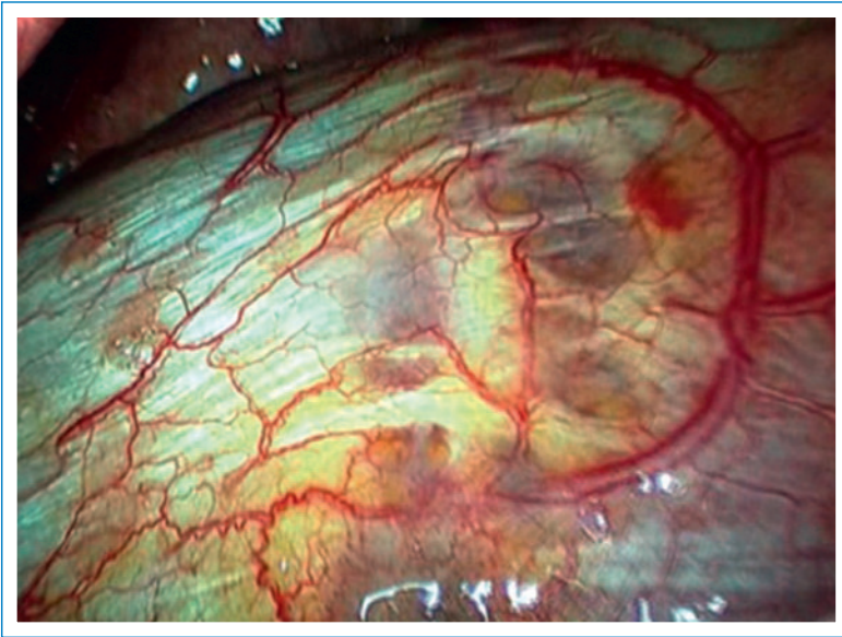
Figure 2 Image per-opératoire du diaphragme poreux.

marquées par l'apparition d'une brèche de la dure-mère secondaire à la pose d'un cathéter de péridurale, nécessitant un alitement prolongé durant 48 heures. Au niveau thoracique, les suites avaient été simples et apyrétiques permettant l'ablation des drains thoraciques à 72 et 96 heures.