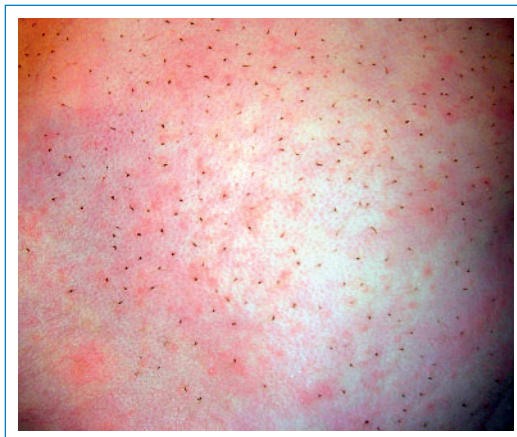
Abbildung 1 Rücken des Mädchens mit feinfleckigem Exanthem und den dunklen Punkten.

Knoten in einem Haarschaft bezeichnet man als Trichonodosis. Die Variante mit Einbezug von mehreren Haarfollikeln wurde 1994 von Itin et al. [1] beschrieben. Haarverknäuelungen können beispielsweise durch Einreiben von Cremes, nach Massagen oder wie hier, durch Reiben auf der Unterlage, auftreten. Die Teledermatologie ist für den Primärversorger in der Praxis eine Möglichkeit, den Spezialisten konsiliarisch beizuziehen [2, 3]. Zur Beurteilung haben auch wir unsere Bilder per E-Mail an die Dermatologie gesandt. Die Mutter konnte so nach kurzer Zeit über die Harmlosigkeit des Befundes aufgeklärt werden.