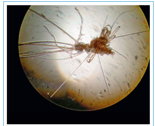
Abbildung 2 Haarknäuel unter dem Lichtmikroskop.