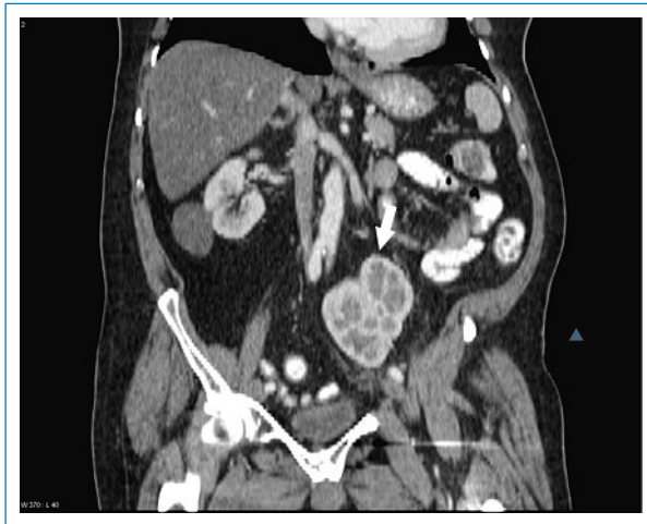
Abbildung 1 CT Abdomen, koronare Rekonstruktion: Pfeil zeigt auf Beckenniere.