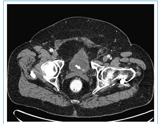
Abbildung 2 CT Abdomen axial: Pfeil zeigt auf Ureterkonkrement.