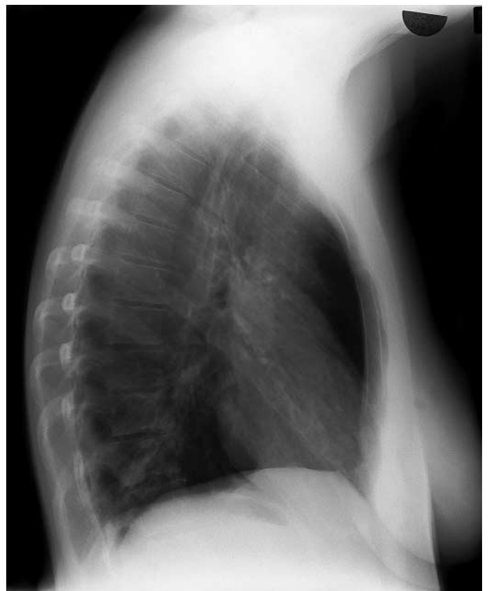
Abbildung 2. Thorax ds.