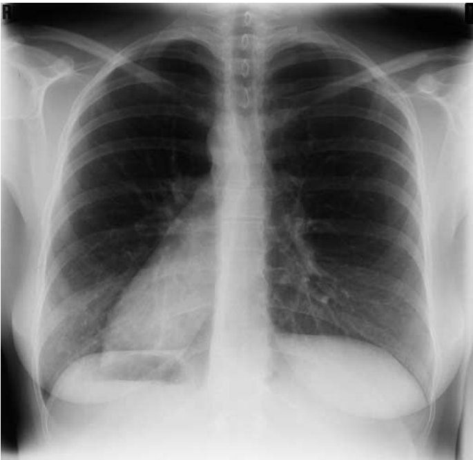
Abbildung 1. Thorax pa.

28jährige Frau; seit Kindheit rezidivierender Husten, Sinusitis mit mukopurulenter Rhinorrhoe.