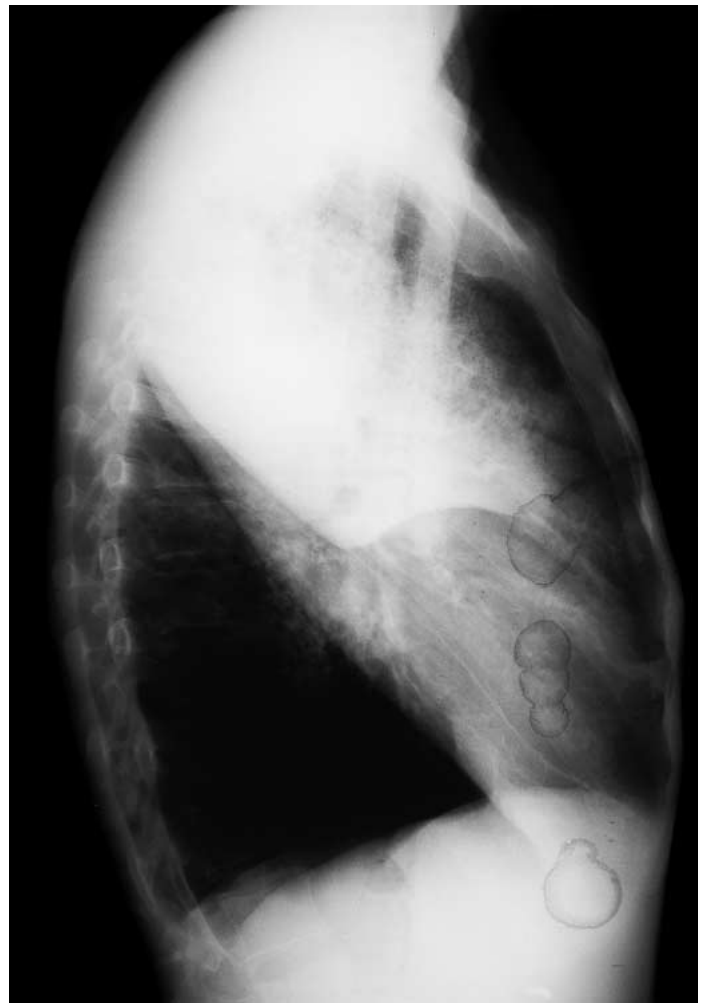
Abbildung 2. Thorax ds.