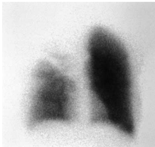
Abbildung 1a. Perfusionsszintigraphie: Perfusionsausfall praktisch des gesamten rechten Oberlappens und teilweise des Mittellappens.

Obwohl bei oben genanntem szintigraphischem Befund zusammen mit dem Röntgenbild und der Klinik in erster Linie an eine Lungenembolie gedacht werden muss, sind differentialdiagnostisch andere, seltene Möglichkeiten in Betracht zu ziehen wie tumorbedingte Einengung der Pulmonalarterien, Vaskulitiden, Status nach Strahlentherapie, kongenitale Lungengefässanomalien, besondere Ausprägungen eines Emphysems und andere mehr [1]. In diesem Zusammenhang erlangt die Bestimmung der D-Dimere mittels Elisa eine wichtige diagnostische Bedeutung, wie unser Beispiel zeigt. Bei normalem Resultat kann wegen der hohen Sensitivität von 99% [2] ein thromboembolisches Ereignis praktisch ausgeschlossen werden. Bei einer Testdauer von etwa 35 Minuten ist die D-Dimer-Bestimmung auch in der ambulanten Medizin nützlich.