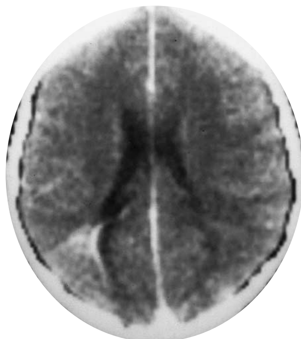
Abbildung 2. Schädel-CT, andere Ebene: Seitenventrikel erweitert!